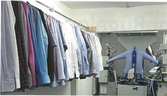
Der neue Hemdenservice der Textilpflege Branscheid wird jetzt im Oberbergischen intensiv beworben.